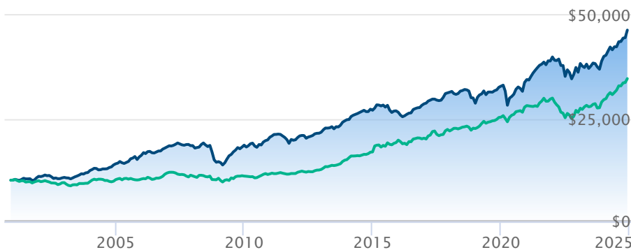
Fonds de croissance et de revenu canadien CI A Indice équilibré mondial Fundata

Les renseignements qui figurent ici ne concernent que les fonds désignés dont le nom figure ci-dessus. Le titulaire d'une police de BMO Société d'assurance-vie n'achète ni part de ce fonds désigné ni intérêt juridique dans aucun titre.