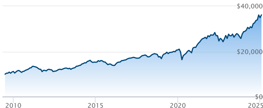
FINB BMO S&P/TSX composé plafonné (ZCN)

Le rendement passé n'est pas garant des résultats futurs. Les taux de rendement indiqués sont les taux de rendement composés annuels historiques globaux et tiennent compte de l'évolution des rendements et du réinvestissement des distributions. Dans le cadre des comptes indiciels gérés, des comptes indiciels de portefeuilles gérés et des comptes indiciels en fonction du marché, des intérêts qui reflètent le rendement net d'un placement sous-jacent déterminé sont crédités, moins les frais de gestion quotidiens de BMO Société d'assurance-vie. Ces taux de rendement ne tiennent pas compte des frais de gestion actuels de BMO Société d'assurance-vie ou des frais actuels de polices d'assurance vie universelle, qu'il faut inclure pour le calcul du rendement net obtenu sur le compte.