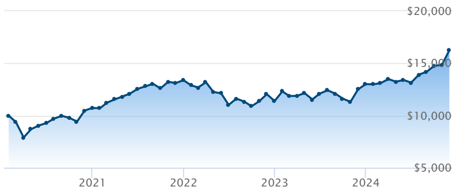
FINB BMO MSCI Canada ESG Leaders (ESGA)